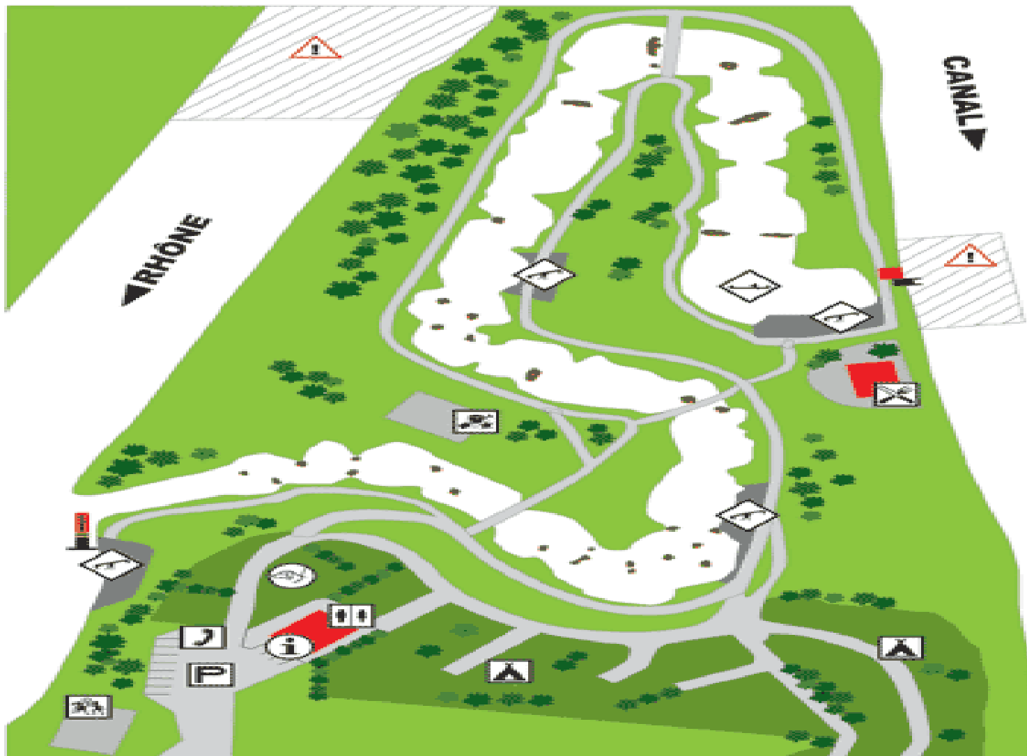
La base: Espace Eau Vive Isle de la Serre